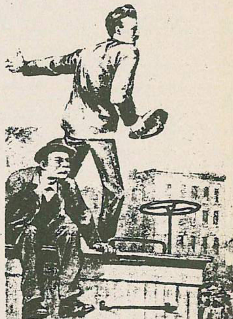
Spies am 3. Mai 1886